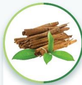
Nano Cinnamomum zeylanicum NDN