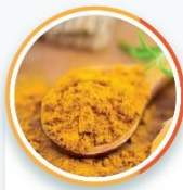
Nano Berberin NDN

Sự kết hợp hoàn hảo của Nano Dược liệu và công nghệ Solid – Lipid tiên tiến