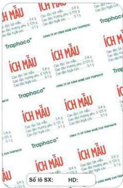
KT vỉ: 62mm x 94mm

LIỀU DÙNG: 1 viên/lần x 3 lần/ngày. Bệnh nặng dùng liều gấp đôi.