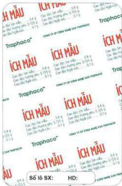
KT vỉ: 62mm x 94mm

LIỀU DÙNG: 1 viên/lần x 3 lần/ngày. Bệnh nặng dùng liều gấp đôi.