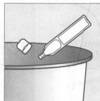
3 Không được tái sử dụng!