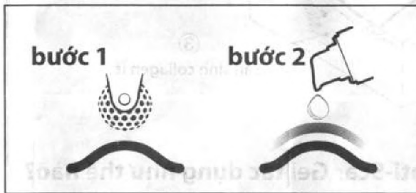
Hình 2: Cách sử dụng viên bi (con lăn) xoa bóp cùng với gel trị sẹo ở những vết thương đã đóng kín hơn một tháng.

Ở những vết thương đã đóng kín hơn một tháng, sử dụng viên bi (con lăn) xoa bóp trước khi bôi Bepanthen® Anti-Scar Gel như mô tả dưới đây: